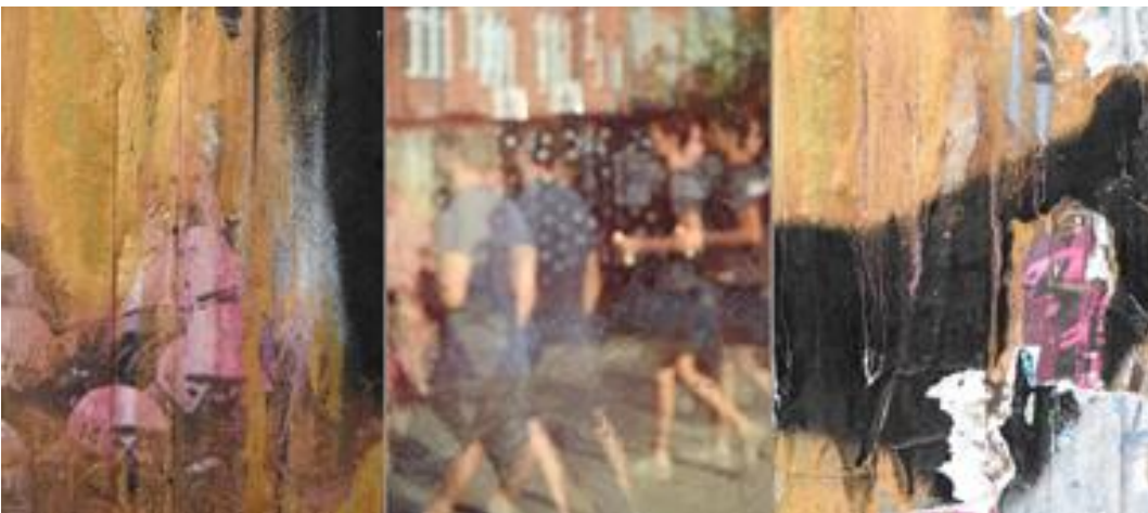
Colour in motion 1 – 3 , 2018, unbearbeitete Fotografie, 120 x 53 cm