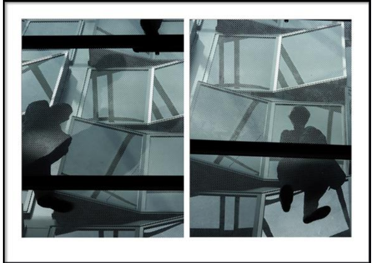
Silhouette 1 - 2, 2019 unbearbeitete Fotografie, 85 x 71 cm