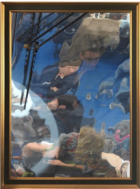
Colour reflections 1 , 2016, unbearbeitete Fotografie, 68 x 78 cm