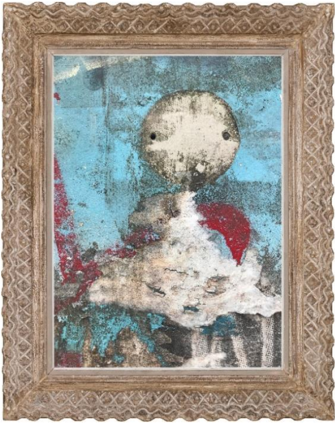
Kiddy scheme , 2020, unbearbeitete Fotografie, 64 x 80 cm