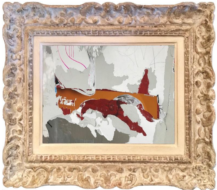
Fairytale dreams , 2020, unbearbeitete Fotografie, 80 x 66 cm