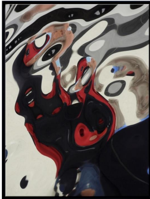
Subway spotting 9, 2020, unbearbeitete Fotografie, Augmented Art, 65 x 85 cm