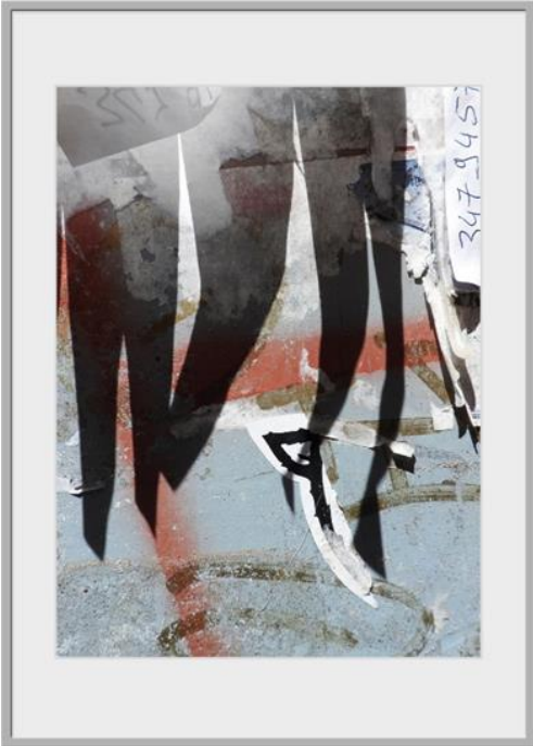
Three-four-seven, 2020, unbearbeitete Fotografie, 60 x 80 cm