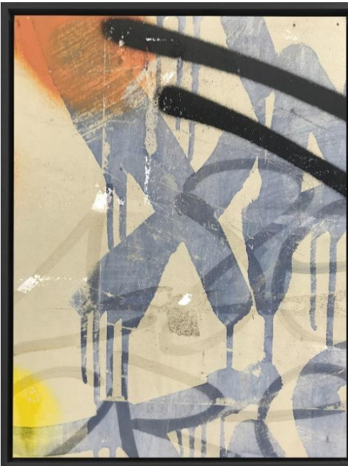
TransparenX, 2020, unbearbeitete Fotografie, 65 x 85 cm